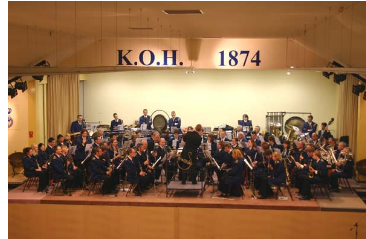
Wilhelmina op het podium in Eijsden

Wij mochten als eerste het podium betreden voor een goed gevulde harmoniezaal. Naast Dancieries speelde we ons inspelwerk Molly on the Shore , het keuzewerk Entornos en als slot Pirates of the Caribbean. Gelukkig zijn de werken voor het WMC van een zodanige muzikaliteit dat het publiek er niet verveeld mee wordt als ze het vaker moeten horen op een avond. Het concert is een weerspiegeling van het resultaat van repetities tot op dat moment. Volgens onze dirigent, die tevreden was met het concert, lagen wij nog precies op schema met onze voorbereidingen dat als doel heeft om op 23 juli in Kerkrade het beste concert te geven van het seizoen.